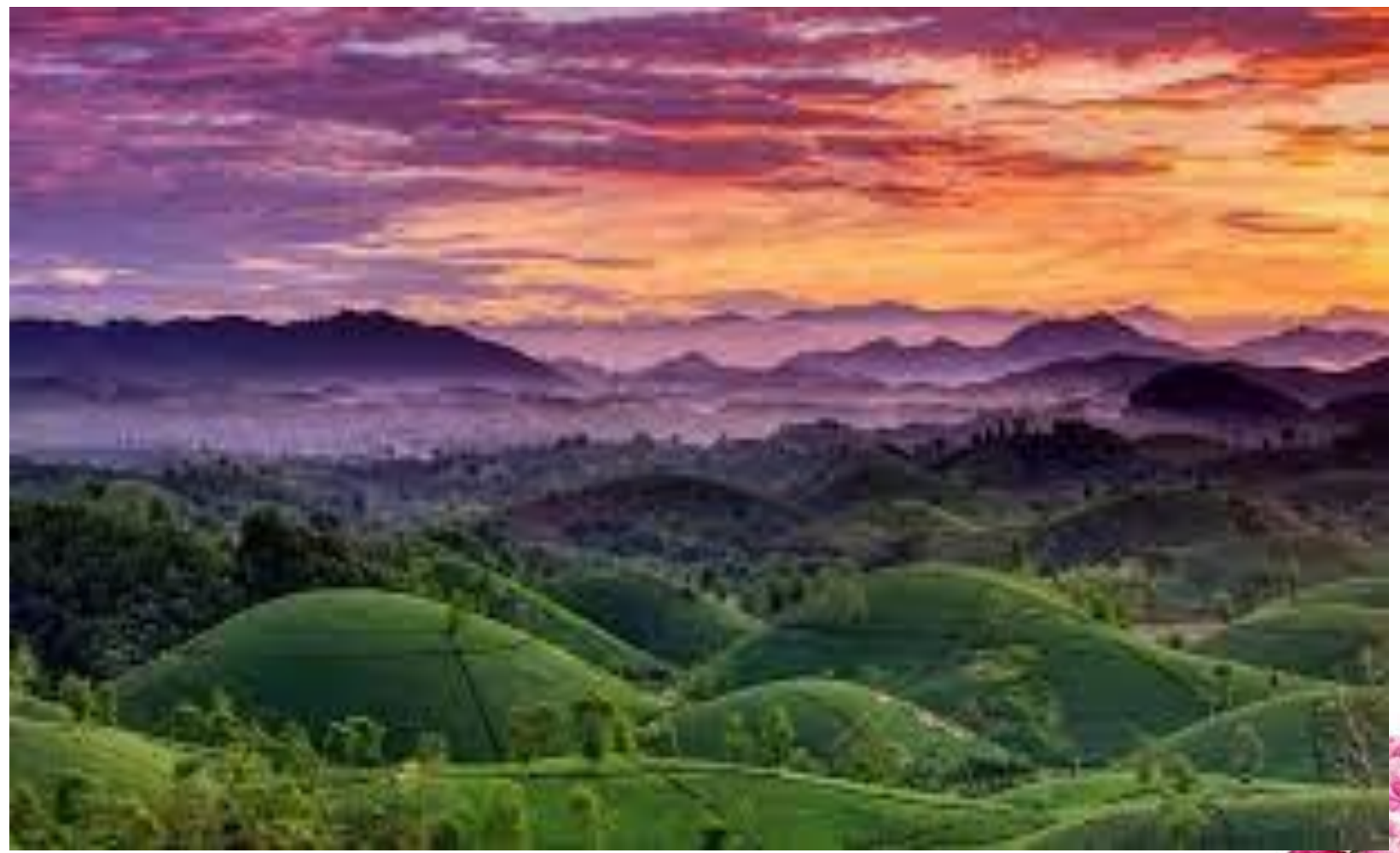
Đồi chè Long Cốc Phú Thọ