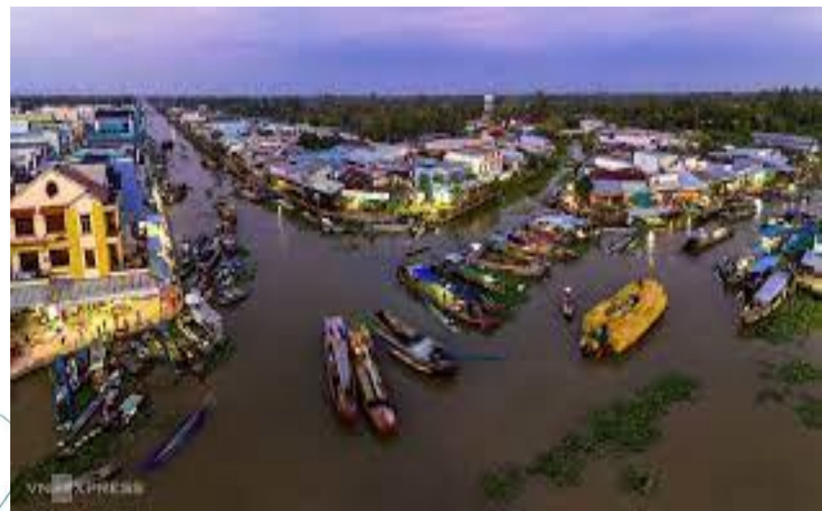
Miền Tây Nam Bộ